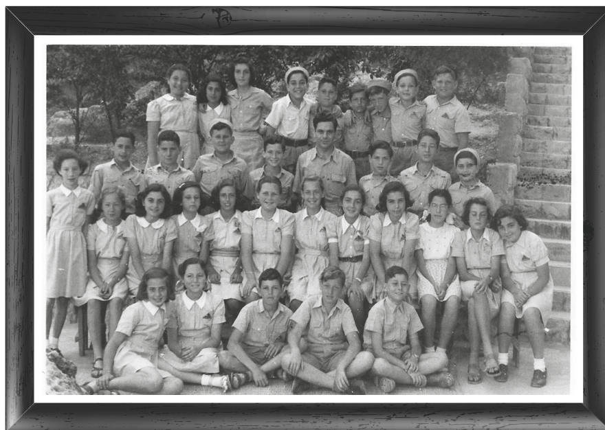
תלמידים בתלבושת אחידה בישראל

לסיכום, אפשר לומר כי סוגיית התלבושת בבתי הספר היא נושא טעון לאורך השנים עד היום. אופייה וחוקיה של התלבושת האחידה שונים ממקום למקום, מבית ספר למשנהו, בין אוכלוסיות ובין תרבויות.